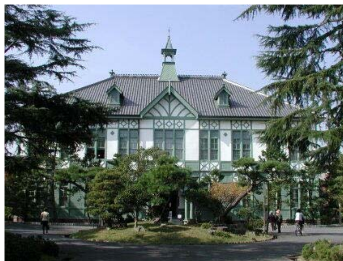
2010年5月 見目正克 (元奈良女子大学教授)